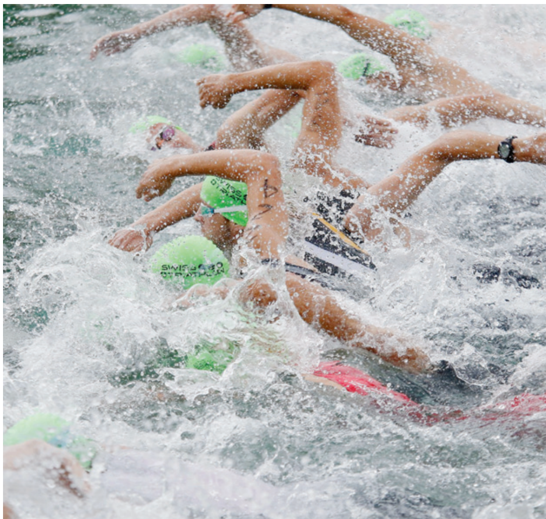
Ils étaient 2293 à avoir pris le départ lors de l'édition 2015. Un record en Suisse.

TRIATHLON A la veille du début des festivités, il est l'heure de faire le point sur les chances de médailles des athlètes helvétiques.